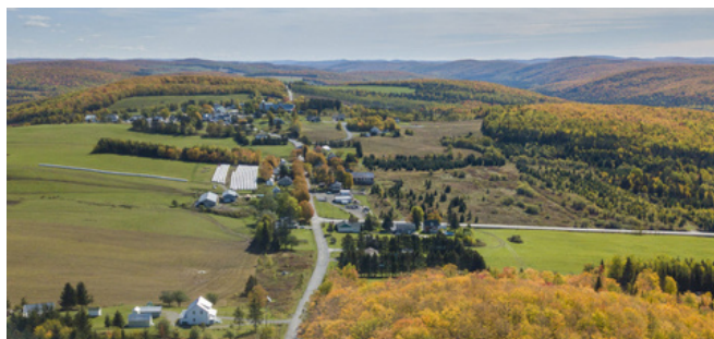
Maison des régions Février 2020

Ministère des Affaires municipales et de l'Habitation (Fonds d'appui au rayonnement des régions) : 197 595 $ Municipalités régionales de comté : 30 000 $ Collectif régional de développement : 167 595 $