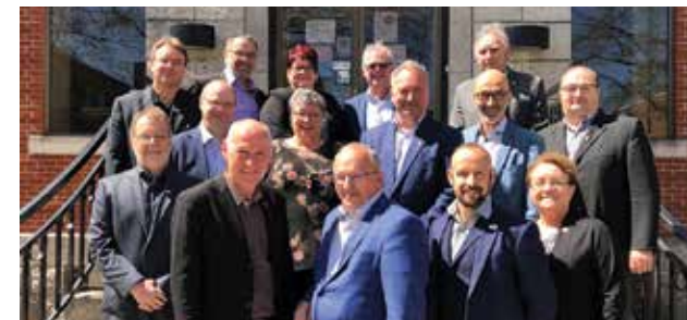
Mai 2019 - Légende à la page suivante

ENVELOPPE BUDGÉTAIRE 2019-2023 Ministère des Affaires municipales et de l'Habitation (Fonds d'appui au rayonnement des régions) : 197 595 $ Collectif régional de développement du Bas-Saint-Laurent : 167 595 $ Municipalités régionales de comté : 30 000 $