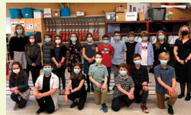
École Roy-Joly, Centre de services scolaire de Kamouraska-Rivière-du-Loup, finaliste