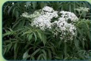
Sureau du Canada