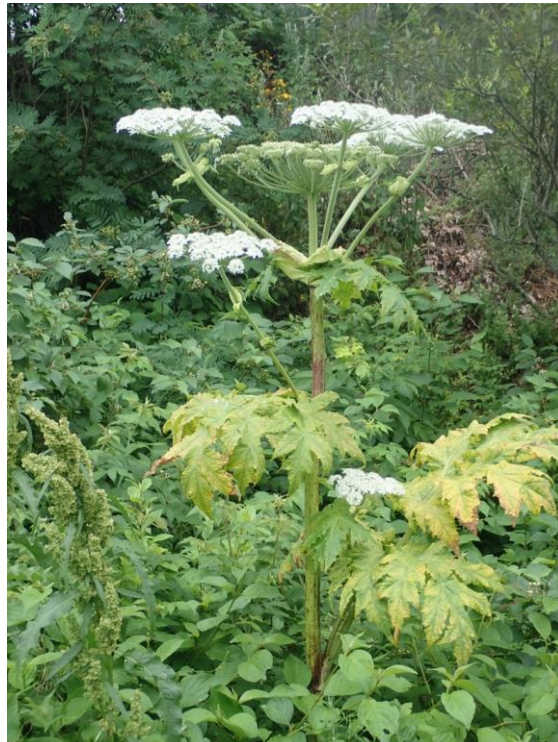
Figure 6. Plant de berce du Caucase mature à Sainte-Blandine - 2 août

Une deuxième phase d'intervention réalisée le 2 août a permis de localiser et d'éliminer environ 60 plants épars sur le site. Un seul plant mature en fleur a été éliminé. Les ombelles de fleurs ont été récoltées et ensachées. Aucun autre plant n'a été observé sur le site lors de ce suivi. Un suivi réalisé sur la petite parcelle traitée au glyphosate indique un succès de l'opération puisqu'aucun plant de berce n'était présent.