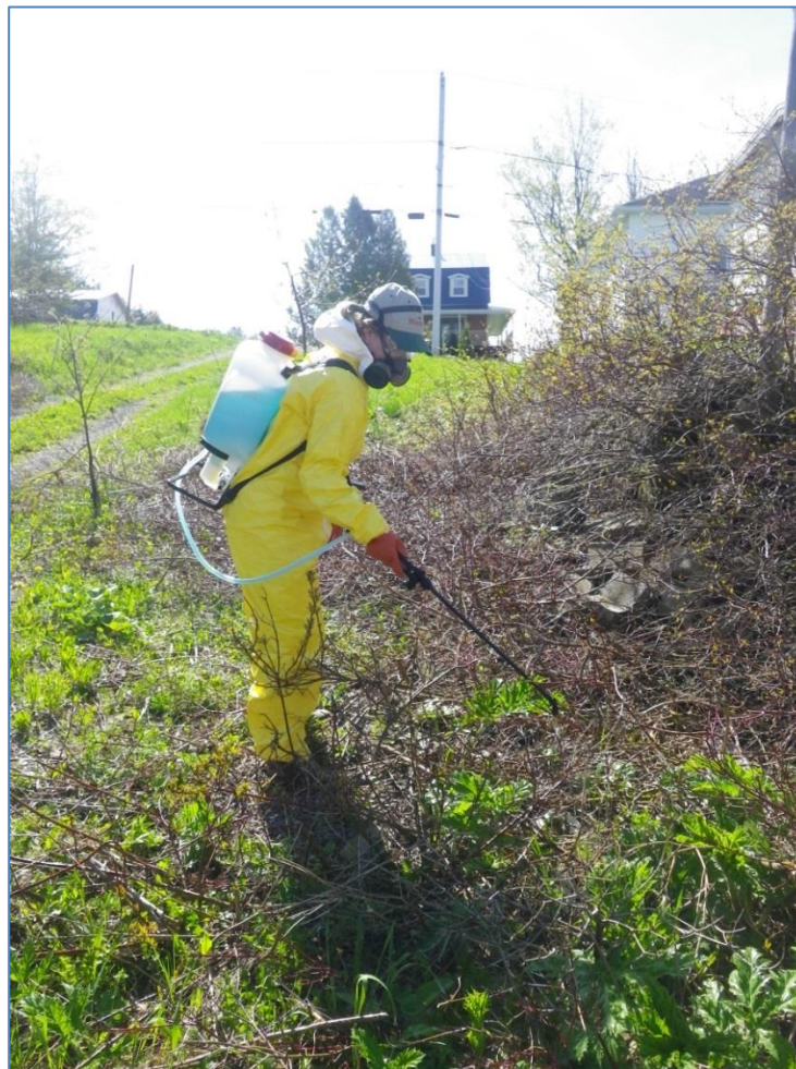
Figure 6. Pulvérisation manuelle de glyphosate à Sainte-Blandine

Le 25 mai, l'agronome et agricultrice Marie-Claude Lavoie a pulvérisé, à l'aide d'un pulvérisateur dorsal, du glyphosate (R/T 540 Herbicide Liquide No. Homologation PCP 28487), d'une concentration de 50 grammes d'ingrédients actif par litre de solution, sur une superficie d'environ 1400 m 2 (figure 6). Le 11 juillet un suivi terrain révèle une efficacité du traitement sur plus de 90% de la superficie traitée. Le succès de l'opération, soit la mortalité des individus, pourra être évalué avec précision au printemps 2018. Lors du suivi, moins d'une centaine de plants ont été recensés sur le site (79 ont été dénombrés et géoréférencés), dont 2 plants matures en fleur (figure 7). Ces deux plants ont été éliminés par extraction à la racine le 12 juillet. Les ombelles de fleurs ont été récoltées et ensachées.