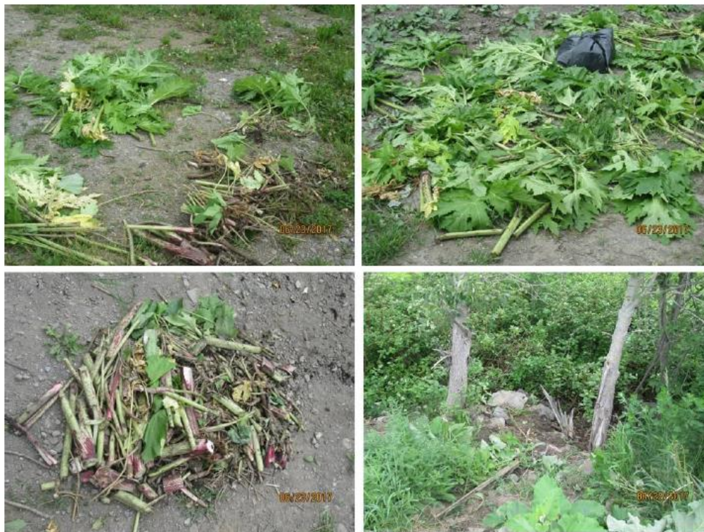
Figure 3. Travaux réalisés à Trois-Pistoles