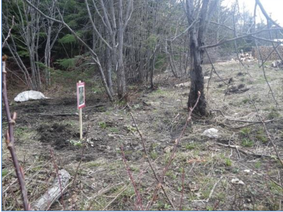
Figure 2. Site de Saint-Guy suite aux interventions d'extraction du 16 mai.