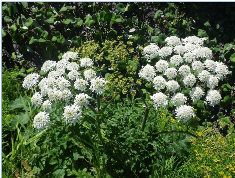
Figure 8. Berce spondyle ( Heracleum sphondylium ) dans un fossé routier à Saint-Joseph-de-Lepage

Description de la colonie : Une première mention de berce spondyle ( Heracleum sphondylium ) a été signalée à l'OBVNEBSL le 7 août 2017. Une petite colonie située dans le fossé la route 132 (côté ouest) comptant quatre individus en fleur a fait l'objet d'une intervention le 8 août par un professionnel de l'OBVNEBSL. Les individus éliminés par extraction à la racine, puis les ombelles de fleurs ont été récoltées. Les fleurs n'avaient pas complété leur maturation en graine et aucune semence ne semble avoir été dispersée en date des travaux. La nature compacte du sol (matériaux de remblai) a rendu difficile l'extraction en profondeur des racines.