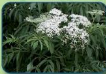
Bureau du Canada