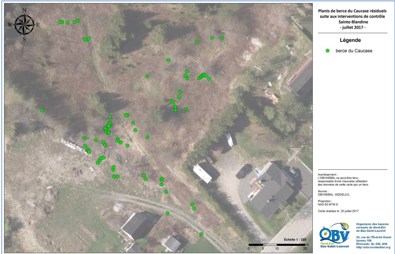
Figure 7. État de la colonie de berce du Caucase suite aux interventions de contrôle – Sainte-Blandine