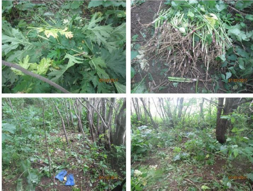
Figure 5. Extraction à la racine de berce du Caucase en secteur boisé

Dans la section boisée, Géo-Gestion a procédé à l'extraction à la racine d'environ 275 plants en date du 30 juin et du 2 juillet (figure 5).