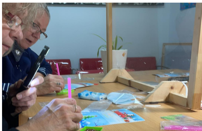
Deux citoyennes du comité AVEC participent aux ateliers de création à la Maison des Tournesols.

Les citoyens et citoyennes qui ont travaillé à créer les cartes ont pu socialiser ensemble - certains et certaines se sont même découvert des talents cachés! Évidemment, les personnes ayant reçu des cartes ont été touchées d'avoir une petite attention à l'approche des Fêtes.